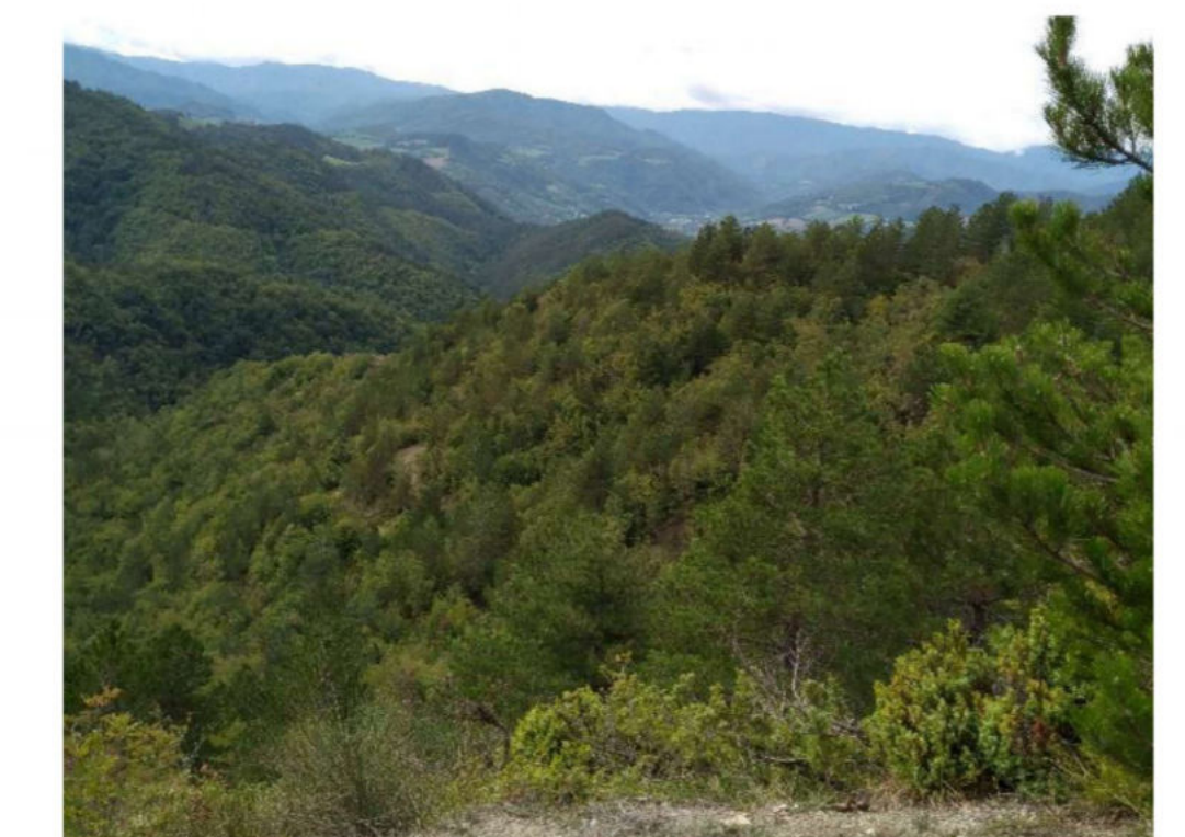
Tav.2C - Carta della viabilità forestale

AMPLIAMENTO DEL PIANO DI ASSETAMENTO FORESTALE NUOVI ASSOCIATI 2023